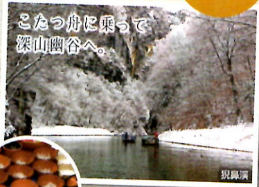
こたつ舟に乗って深山幽谷へ。現興溪