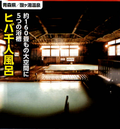
青森県/酸ヶ湯温泉