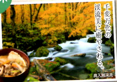
千変万化の溪流美に癒やされる。奥入瀬溪流