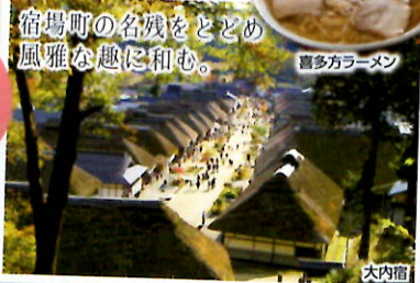
宿場町の名残をどどめ風雅な趣に和む。