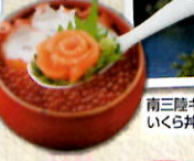
南三陸キラキラいくら丼