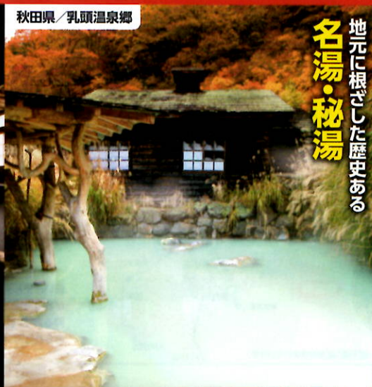
秋田県/乳頭温泉郷