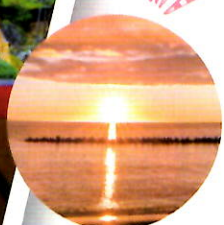
瀬波温泉 からの夕日