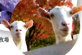
伊香保グリーン牧場