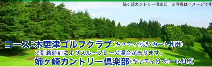
姉ヶ崎カントリー倶楽部 ※写真はイメージです

コース:木更津ゴルフクラブ(キャディ付き・カート利用) ※到着時刻によりスループレーの場合があります。 姉ヶ崎カントリー倶楽部(キャディ付・カート利用)