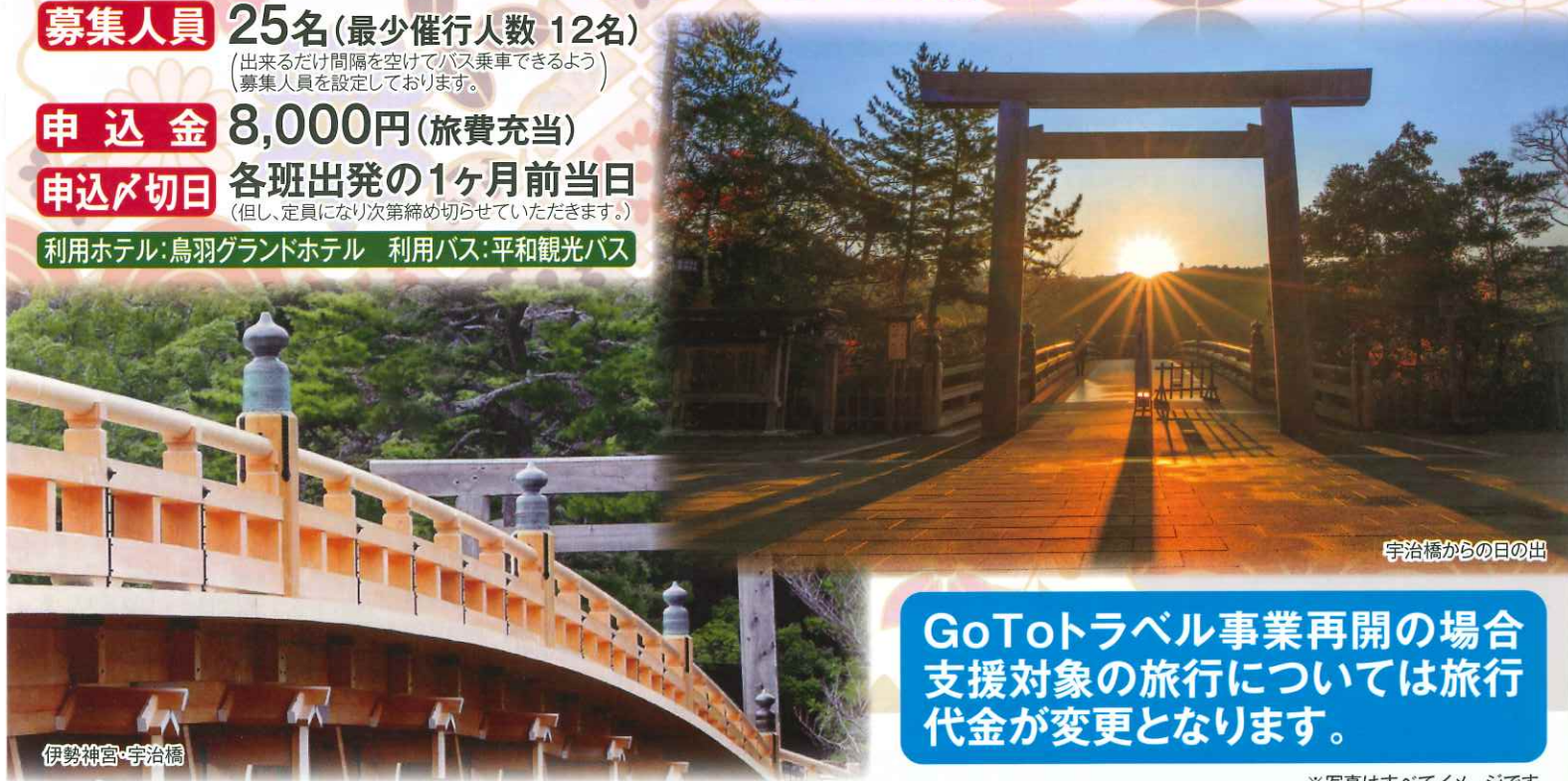
宇治橋からの日の出