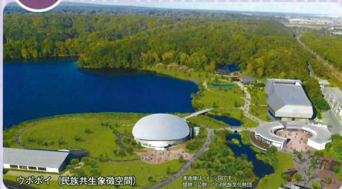
ウポポイ (民族共生象徴空間)