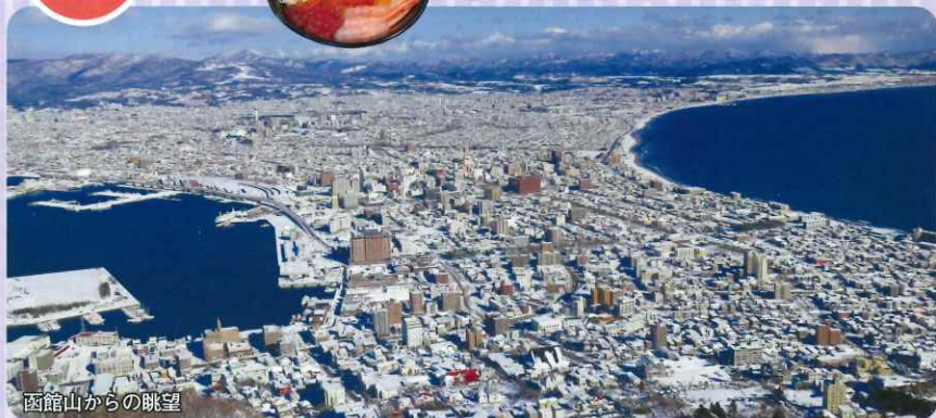
函館山からの眺望