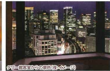
タワー館客室からの景色(夜・イメージ)