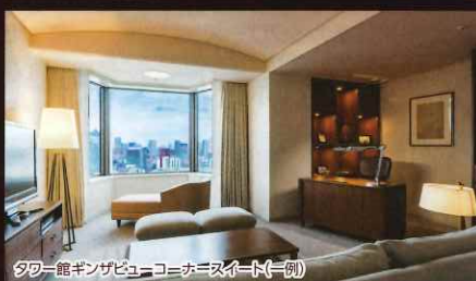
タワー館ギンザビューコーナースイート(一例)