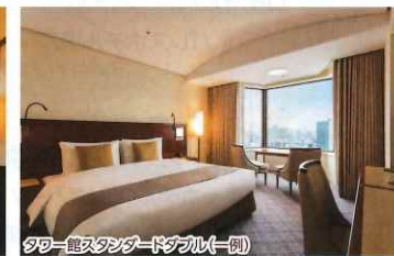
タワー館スタンダードダブル(一例)