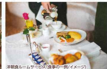
洋朝食ルームサービス(食事の一例/イメージ)