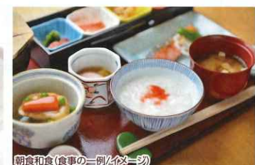
朝食和食(食事の一例/イメージ)