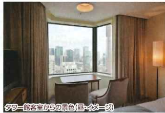
タワー館客室からの景色(昼・イメージ)