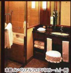
本館インペリアルフロアバブルルーム(一例)