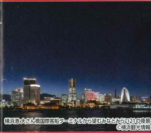
横浜港 大さん橋国際客船ターミナルから望むみなとみらい21の夜景