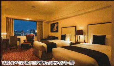
本館インペリアルフロアデラックスツイン(一例)