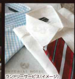
ランドリーサービス(イメージ)