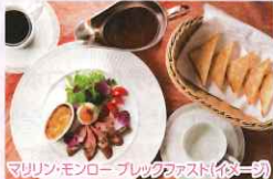
マリリン・モンローブレックファスト(一例)