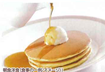
朝食洋食(食事の一例/イメージ)