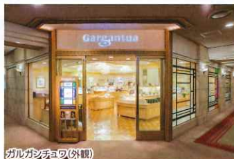
ガルガンチュウ(外観)