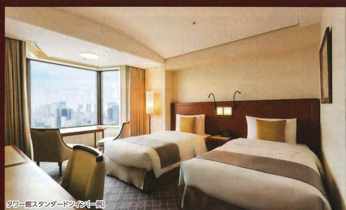
タワー館スタンダードツイン(一例) シンプルでありながら、細部までお客様に寛いでいただけるようなつくりとなっています。

1890年、海外からの賓客をお迎えする「日本の迎賓館」として誕生した日本を代表する名門ホテルです。日比谷、銀座にも近く、ハイランクショッピングや観劇をお楽しみいただける便利な立地です。客室は「伝統と革新」をテーマにした本館と、落ち着きと機能性を兼ね備えたタワー館からお選びいただけます。