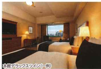
本館デラックスツイン(一例)