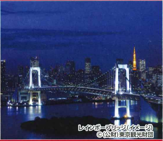
レインボーブリッジ(イメージ)