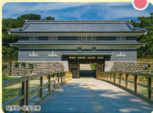
鼠多門・鼠多門橋