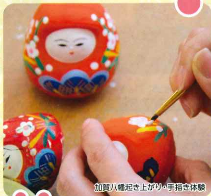
加賀八幡起き上がり・手描き体験