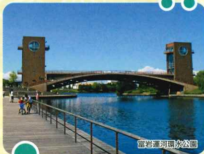
富岩運河環水公園