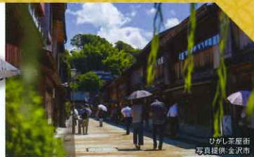
むかし茶屋街 温泉提供金沢市