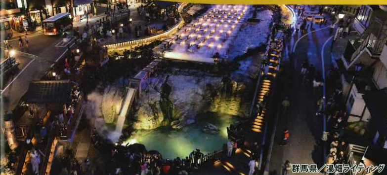
群馬県 湯畑ライティング