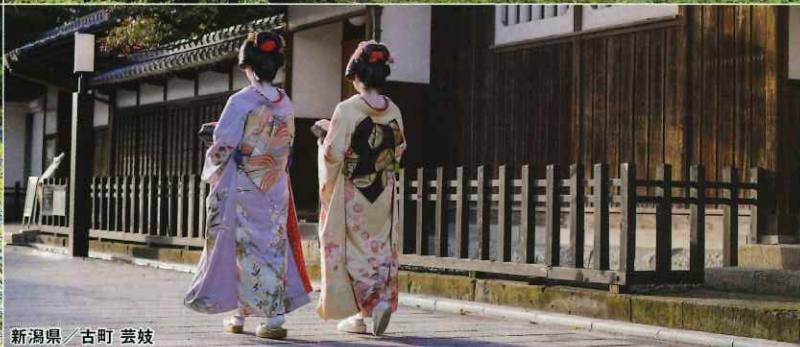
新潟県 古町 芸妓