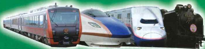
海里/上越新幹線 E7・E4系/SL