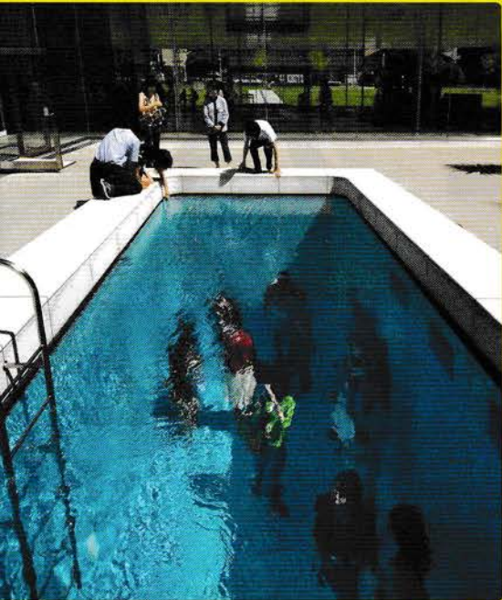
レアンドロ・エルリッヒ《スイミング・プール》2004年 金沢21世紀美術館蔵