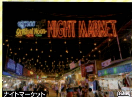
ナイトマーケット

暑さがおさまる夜はシェムリアップの街も賑わいます。 慣れない土地での夜歩きもガイドと一緒になら安心です♪