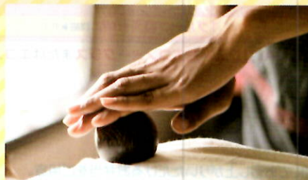
カンボジア伝統マッサージ