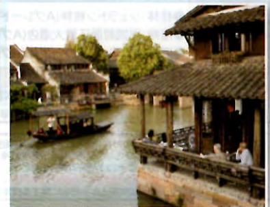
運河沿いのカフェでほっこり休憩。