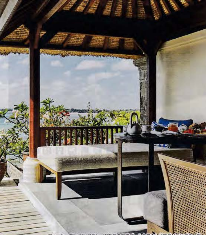
フォーシーズンズ ジンババシ/お部屋の専用プール&アウトドアダイニングの一例