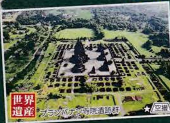
世界遺産 プランバナン寺院遺跡群 ★