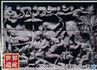
世界遺産 ボロブドゥール遺跡群 ★

ポイント2 ジャワ島 5日間コースでは ジョグジャカルタ3連泊 で、ゆったりと観光します。観光時には 毎日おしぼりと飲料水 をご用意。