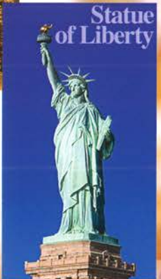
Statue of Liberty