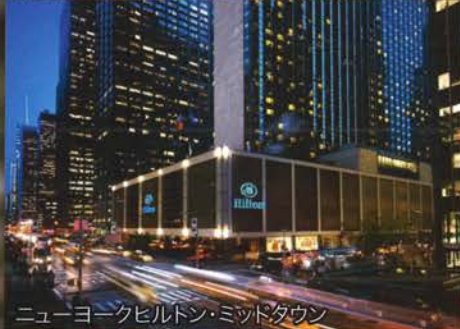
ニューヨークヒルトン・ミッドタウン