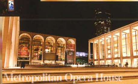
Metropolitan Opera House